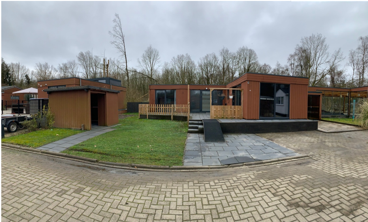
Vakantiepark 't Urkerbos