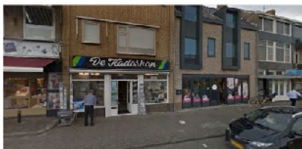
Klifweg 7 8321 EH Urk