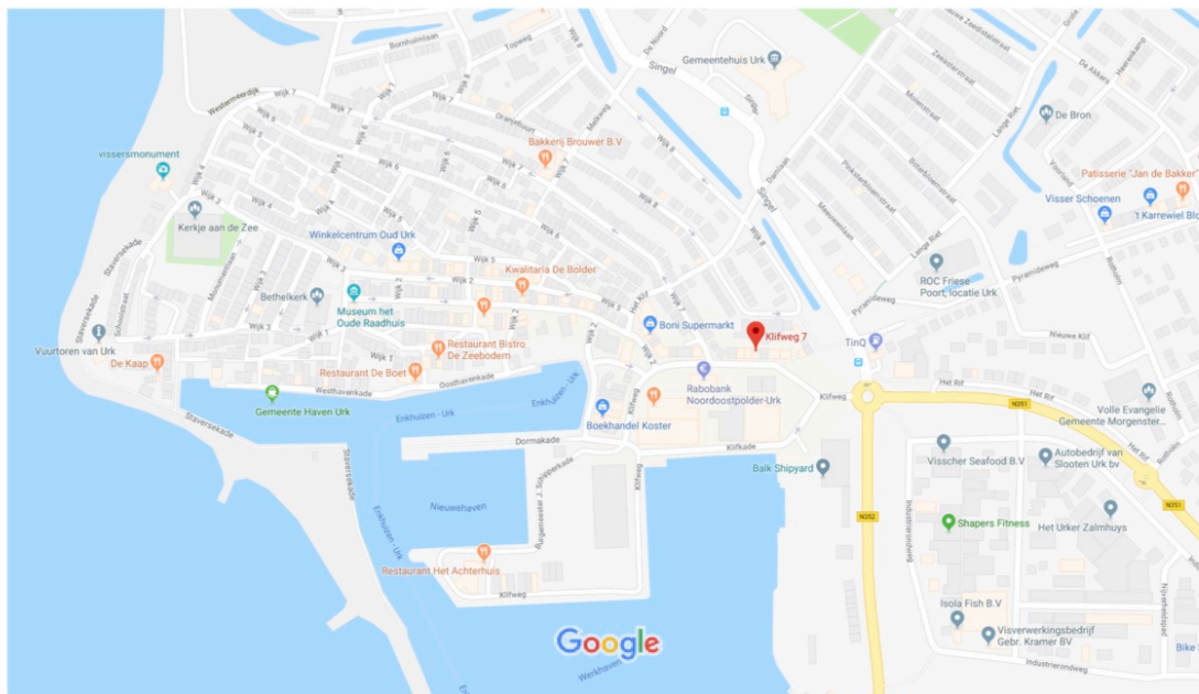
Kaartgegevens ©2018 Google 50 m